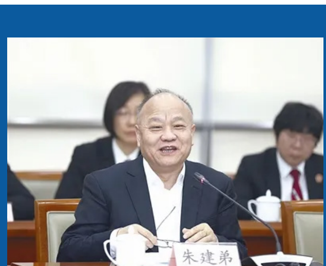
图为全国人大代表朱建弟参加座谈并发言。

朱建弟表示，2023年以来，上海法院按照党中央和上海市委的战略部署要求，紧紧围绕“公正与效率”工作主题，积极推进数字法院建设，取得了显著成效。首先，建设数字法院极大提高了司法效率。数字法院通过在线立案、电子送达、远程庭审、数据互通等方式，极大地提高了司法程序的效率。这不仅减少了当事人和律师的等待时间，也使得法院工作人员能够更快地处理案件，提升了整体的工作效率。其次，建设数字法院能够优化司法服务。朱建弟建议，上海金融法院要继续发挥好上海金融市场完善的区位优势、全国首家金融专门法院的首发优势和集中管辖的司法优势，在办难案、办首案、办具有规则创设意义的案件中持续发力和精进，有力防范和化解金融风险，推动上海金融营商环境高地建设，为提升国际金融中心软实力提供更强司法保障。